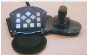
Joystick and Keypad Control