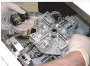
S100 Head Unit installed in Chamber